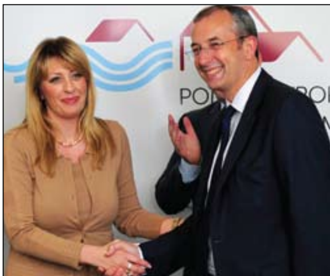
Министарка Јадранка Јоксимовић и Мајкл Девенпорт, шеф Делегације ЕУ у Србији

Шеф Делегације ЕУ у Србији, Мајкл Девенпорт, и министарка задужена за европске интеграције, Јадранка Јоксимовић, потписали су у Обреновцу споразум о одобравању 30 милиона евра бесповратне финансијске помоћи, из претприступних ИПА фондова, за обнову 24 општине после мајских поплава.