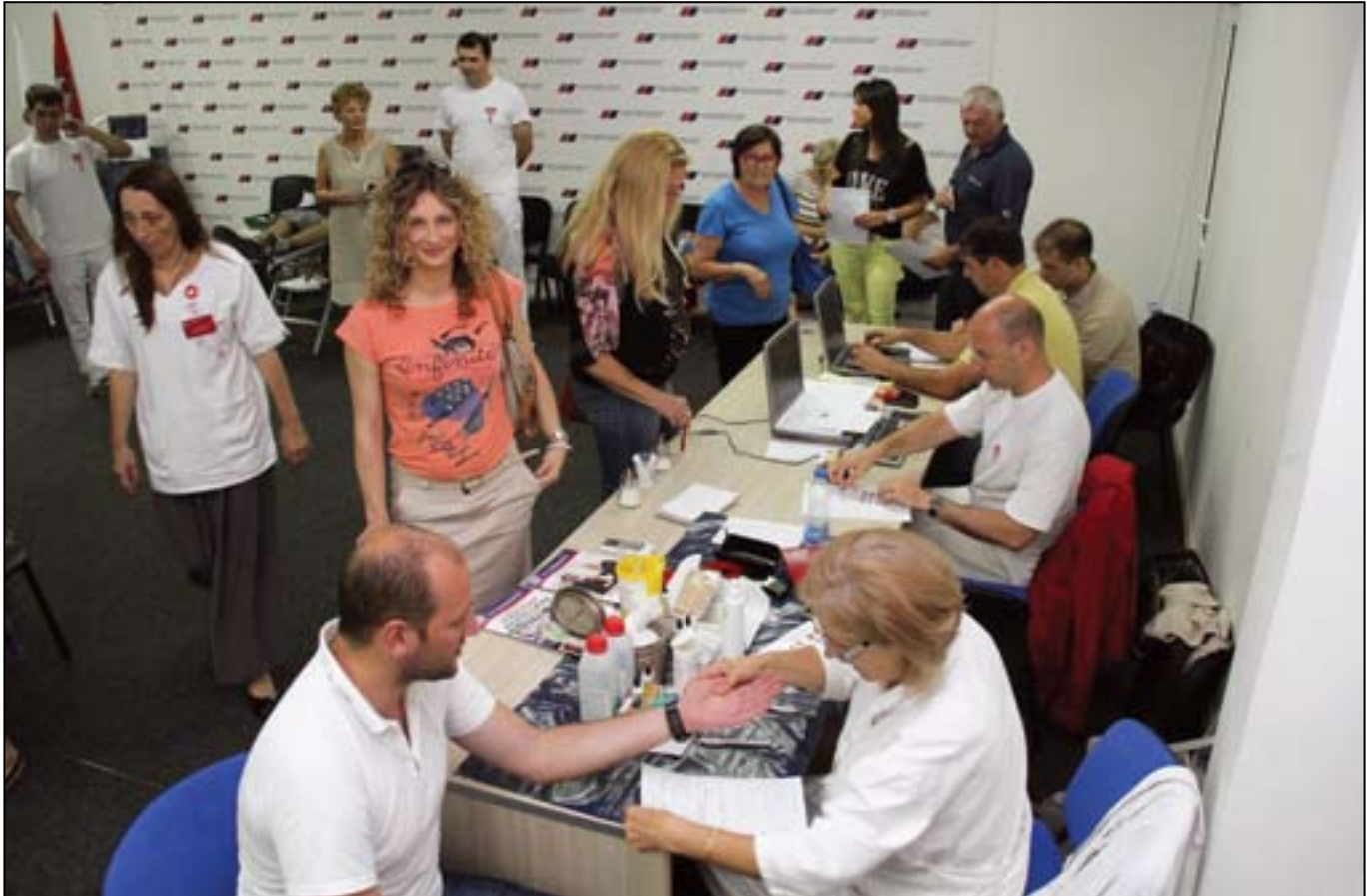
Велики број страначких активиста из Београда одазвао се позиву и добровољно дао крв у просторијама ГО СНС Београд