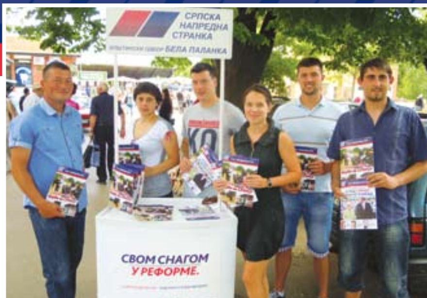
Млади напредњаци у Белој Паланци

У Црепаји је уређен парк, постављено је осветљење, избетонирана стаза и уређења зелена површина. Други пут, у току ове године, очишћена је депонија код Железничке станице. КУД „Свети Сава“ прославио је десет година постојања. Мото клуб „Спид хантерс“ организовао је скуп, на коме су се окупиле гости из земље и иностранства. Постављене су уградне кутије које регулишу паљење и гашење уличног