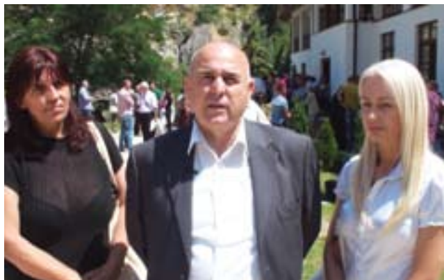
Напредњаци Краљева у посети манастиру Свети Архангели код Призрена