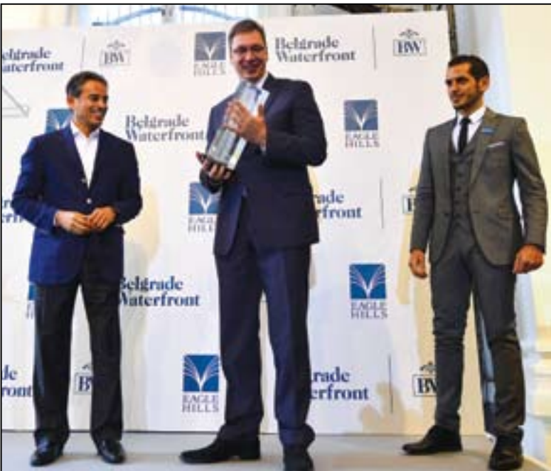
Премијер Вучић добио је од Мухамеда Ел Абара на поклон стаклену макету Београдске куле