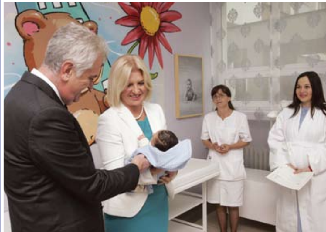
Председник Николић са супругом Драгицом у просторијама које су обновљене први пут после 34 година

„Ово је друго породилиште које је реновирано уз помоћ Фондације „Драгица Николић“, ускоро ће и Нови Пазар добити ново породилиште, а реновирање чекају још 73. У породилиште у Врању 34 година ништа није улагано. Министар здравља ми је рекао да је проблем ако се породилиште не реновира у току само пет година, а замислите колико је овде прошло времена. Морам се, на сваком кораку, борити за нашу децу, за нашу будућност“, истакао је председник Србије, Томислав Николић.