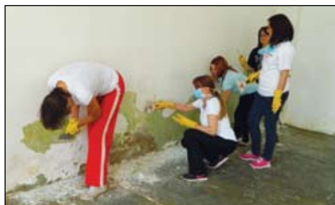
Вредни активисти Интернет тима СНС и Градског одбора СНС Београд у заједничкој радној акцији