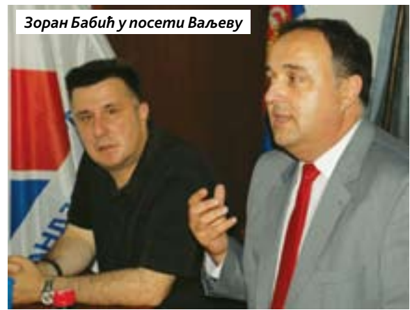
Зоран Бабић у посети Ваљево