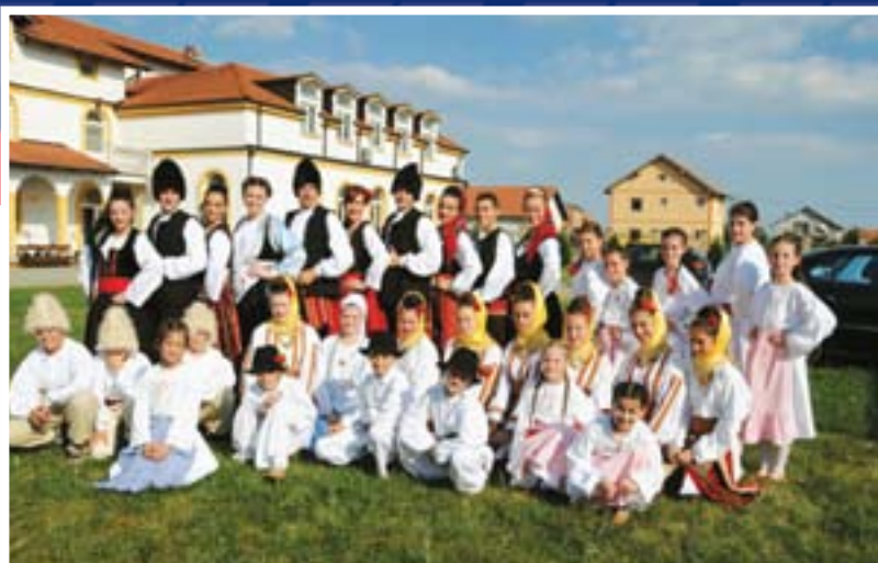
Манифестација „Крајишки откос“ у Бусијама

која је у поплавама претрпела велику материјалну штету, на иницијативу Службе за информисање СНС, Интернет тима и ГО Београд.