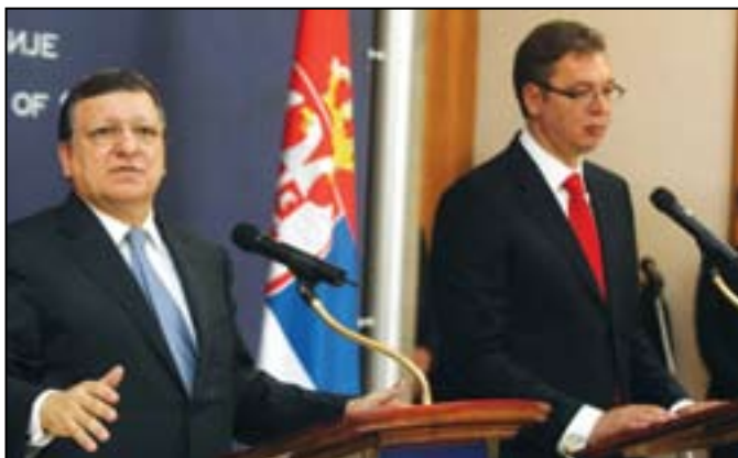
Гост Београда био је Жозе Мануел Барозо, председник Европске комисије

У претходном периоду, у Београду је одржан и један несвакидашњи састанак – заједничка седница влада Републике Србије и Републике Мађарске, на којој је истакнуто да су односи две државе у успону. Мађарску делегацију предводио је премијер Виктор Орбан, а разговарало се о разним питањима, од мађарске подршке Србији на европском путу, до изградње железничке и путне инфраструктуре, посебно изградњи пруге Београд - Будимпешта и Суботица - Сегедин - Баја, и отварању већег број граничних прелаза. Потписано је и више споразума из области саобраћаја, животне средине и међуполицијске сарадње.