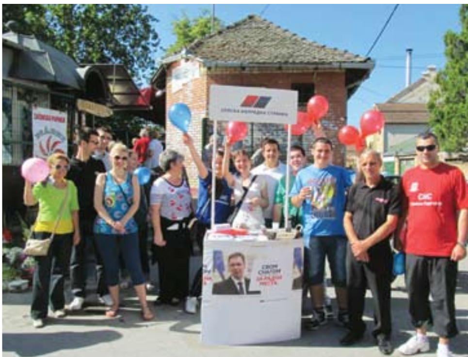
Акција „Да се не заборави“ у Сремским Карловцима