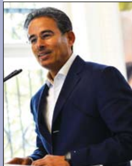
Мухамед Ел Абар

„Раст туристичке и пословне активности, до које ће доћи кад заживи „Београд на води“, начиниће од Београда центар региона. Видели смо како је у протеклом периоду расла ваша национална авиокомпанија, зато што је паметно инвестирати, и зато што се она добро води, исто ће се догодити и са овим пројектом“.