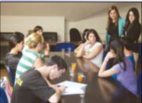
Радионица о болестима зависности и подела „СНС Информатора“ на Савском венцу

Активисти ОО Обреновац и даље активности усмеравају на санацију штете од поплава. Још једна у низу акција било је уређење Техничке школе Обреновац,