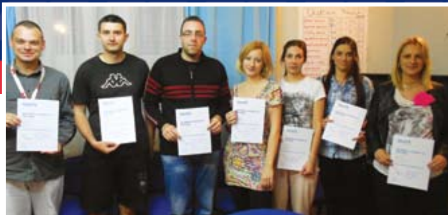
Обука за писање пројеката младих напредњака Кикинде

СНС чине све да, иако су изван локалне власти, најугроженијим становницима изађу у сусрет, било прикупљањем хуманитарне помоћи, било обичним разговором.