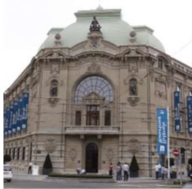
Обновљена зграда „Геозавода“ у Карађорђевој