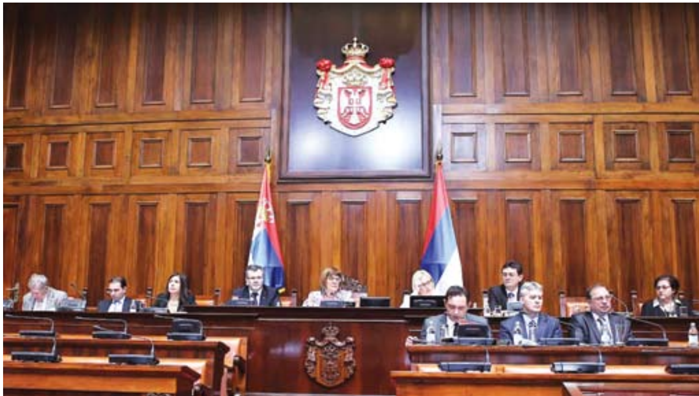
Расправа у Народној скупштини поводом Предлога измена и допуна Закона о раду

нутку 2008. године чак 22 одсто, иако за то није било никакве економске основе. Реч је била о чисто политичким одлукама, неким је то било потребно да раде пред изборе, а неким после, да би правдали своје коалиције. Зато смо дошли у ситуацију да изгубимо, у међувремену, 705 милијарди динара. И када нам бесрамно кажу - расте јавни дуг, кажем да расте јер исплаћујемо оно на шта су нас они обавезали, да враћамо камате које нам расту из дана у дан. Имамо нездрав систем, трошимо много више од онога што зарадимо. И зато нам је хитно потребно да оз-