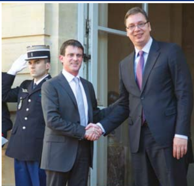
Премијер Вучић са премијером Француске, Мануелом Валсом, у Паризу