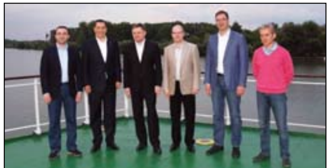
Премијер Вучић приликом посете Румунији и неформалног сусрета са премијерима пет држава - Виктором Понтом (Румунија), Јуријем Леанком (Молдавија), Иракли Гарибашвилијем (Грузија), Робертом Фицом (Словачка) и Бохуславом Сobotком (Чешка)

Као главни утисак са сусрета у Паризу, премијер Вучић је нагласио да је Србија добила пуну подршку за напоре на путу реформи, а да су француске компаније заин-