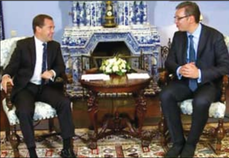
Пријатељски разговор: Александар Вучић са премијером Руске Федерације, Дмитријем Медведевом, током посете Москви