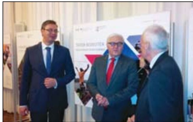
Сусрет са Франком Валтером Штајнмајером, немачким министром спољних послова, и немачким привредницима, у Берлину