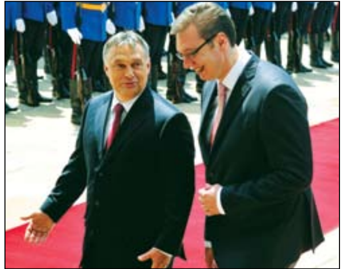
У Београду је одржана заједничка седница Влада Мађарске и Србије: Премијери Виктор Орбан и Александар Вучић